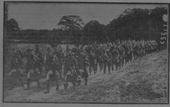
SOLDADOS ESCOCSES REGRESANDO DE LAS TRINCHERAS

Ya pronto como las tropas salen de la zona de combate donde tan heroicamente se igual sacrifican sus comodidades y de irman su sangre, se las lleva a lugar tranquilo de la línea de